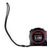
コンベックス ルール (3m)