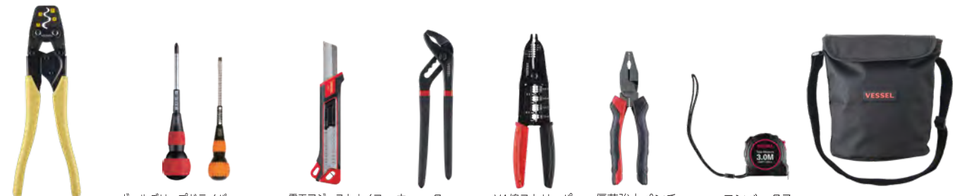
圧着工具 (リングスリーブE用) ボールグリップドライバー No.220 (Φ2×100・Φ5.5×100) 電工アジャストナイフ No.DAK-1 ウォーターポンププライヤー (230mm) VA線ストリッパー 偏芯強力ペンチ (175mm) コンベックスルール (3m) 収納ケース