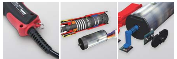
本体と電源コード一体式で引っ張りによるコネクタ部の故障を防止

ブラシレスのためカーボンブラシの交換が不要。モーターの寿命も長く、通常使用で3年間使用できます。さらに、故障の少ないマグネットスイッチを採用しています。