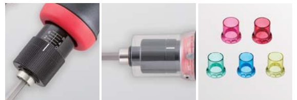
16段階8目盛の調整が可能

トルク調整のピッチが細かいので、精密な調整が可能です。いじり止めスリーブを全機種標準で付属しているため、トルク調整の誤操作も防ぐことができます。