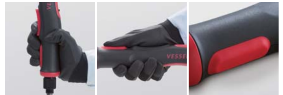
抜群の操作性、縦打ちにはレバー式

本体を握るとレバー位置が自然と指にフィットする形状、柔らかく振動を吸収するゲルパッド、すべりにくい表面仕上げなど、人間工学に基づいたデザインです。